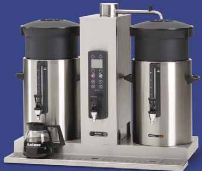
ComBi-line mit zwei Getränkebehältern und separatem Wasserkocher in der Brühsäule: CB 2x...W.