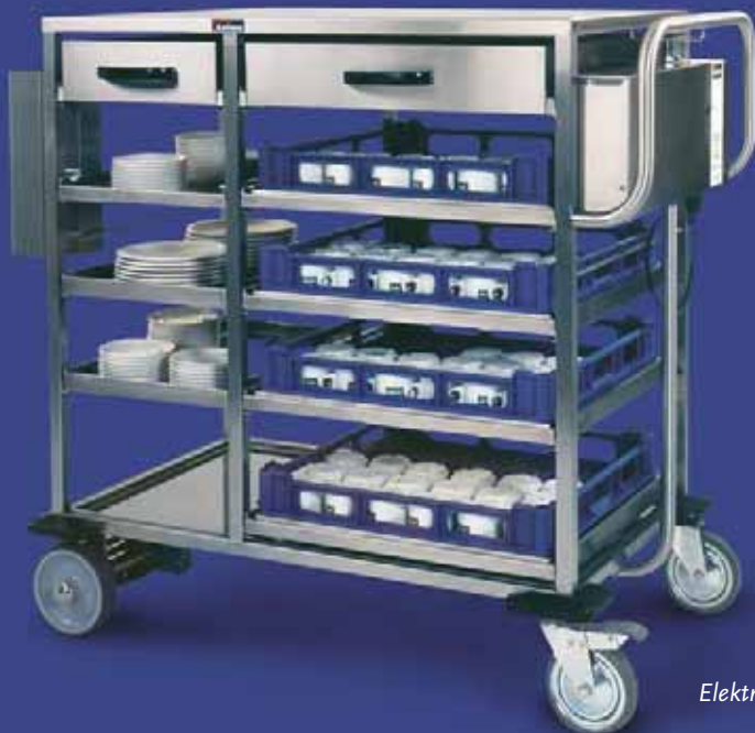
CB ...W, Wandbefestigung in Kombination mit Servierwagen 'JR'

Auch für die Kaffee- und Teeversorgung in Krankenhäusern oder Altenheimen ist die ComBi-line in Verbindung mit einem Servierwagen ideal. Animo verfügt über ein breites Spektrum an Servierwagen und Zubehör. Von einem einfachen Servierwagen für einen Getränkebehälter bis zum umfassenden Servierwagen mit elektrischem Antrieb für zwei Behälter. Erkundigen Sie sich nach den Möglichkeiten und fordern Sie die Unterlagen an.