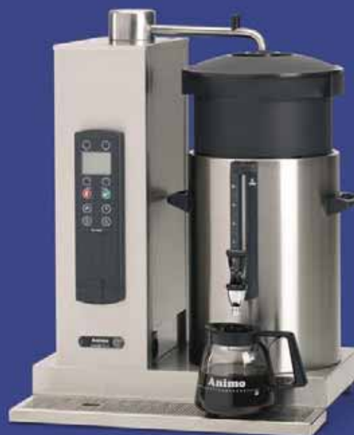
ComBi-line mit einem Behälter rechts: CB 1x...R.

Setzen Sie vor dem Teekochen das spezielle Teesieb in den Behälter ein.