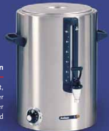
Abb. WKT-D 10n.

Werden große Mengen Heißwasser benötigt, so können Sie einen Getränkebehälter der Buffetanlage durch einen Wasserkocher mit gleichem Inhalt ersetzen. Effizient und praktisch.