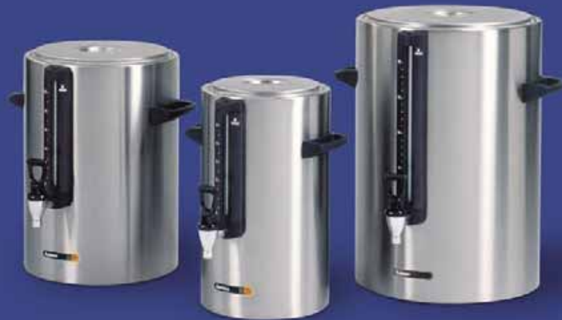
Die Behälter sind in isolierten (rechts) und elektrischen Ausführungen (links und Mitte) von 5, 10 und 20 Litern lieferbar. Behälter mit gleichen Inhalten sind stapelbar.

Absolute Voraussetzung für die Aufbewahrung von Kaffee und Tee ist natürlich die richtige Temperierung des Behälters. Animo liefert zwei Ausführungen Getränkebehälter: eine isolierte (CNI) und eine elektrisch beheizte (CNE). Die CNI Behälter haben eine Polyurethanisolierung und garantieren hierdurch die optimale Temperatur von warmen und kalten Getränken. Die CNE Behälter halten die optimale Temperatur Ihrer heißen Getränke, wodurch der Geschmack frisch und gut erhalten bleibt. Zudem ist die Wärmeübertragung gering; die Behälter werden an der Außenseite nur lauwarm.